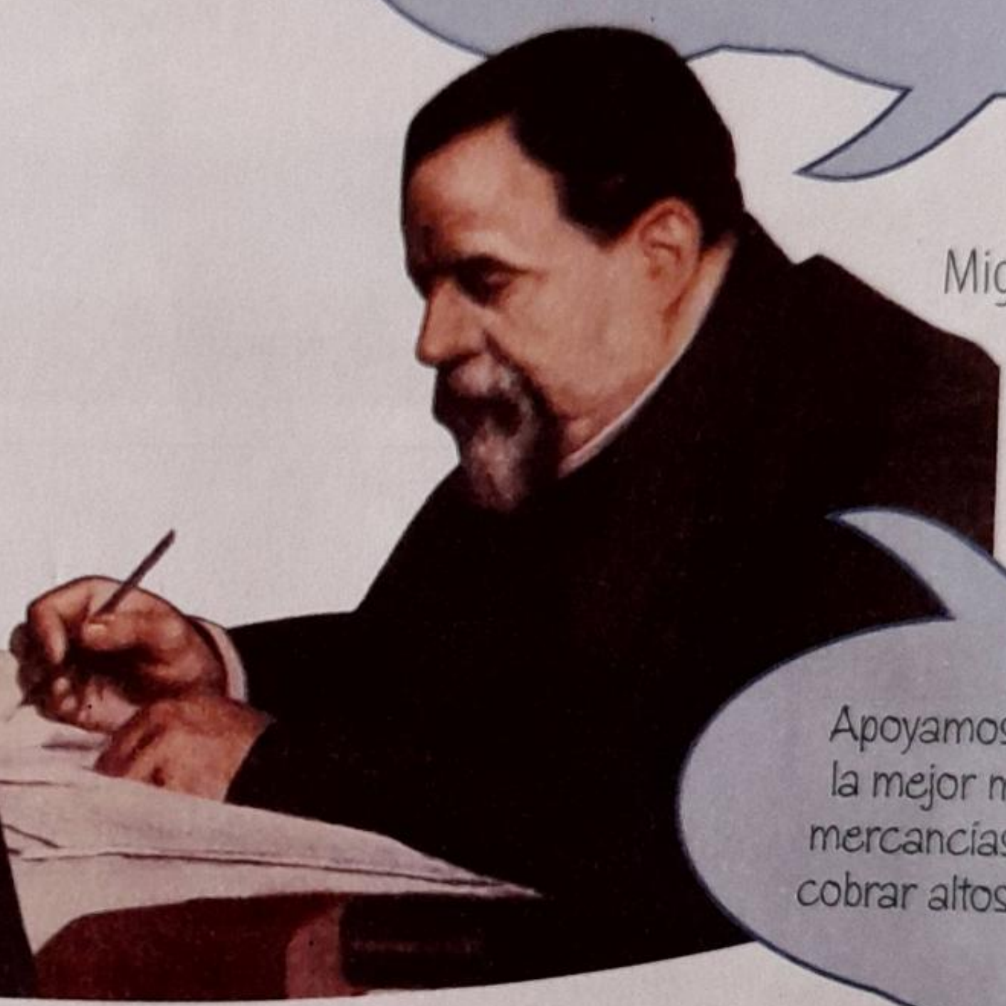
Miguel Antonio Caro.

Sólo deben votar los hombres mayores de 21 años que sepan leer, escribir y posean bienes.