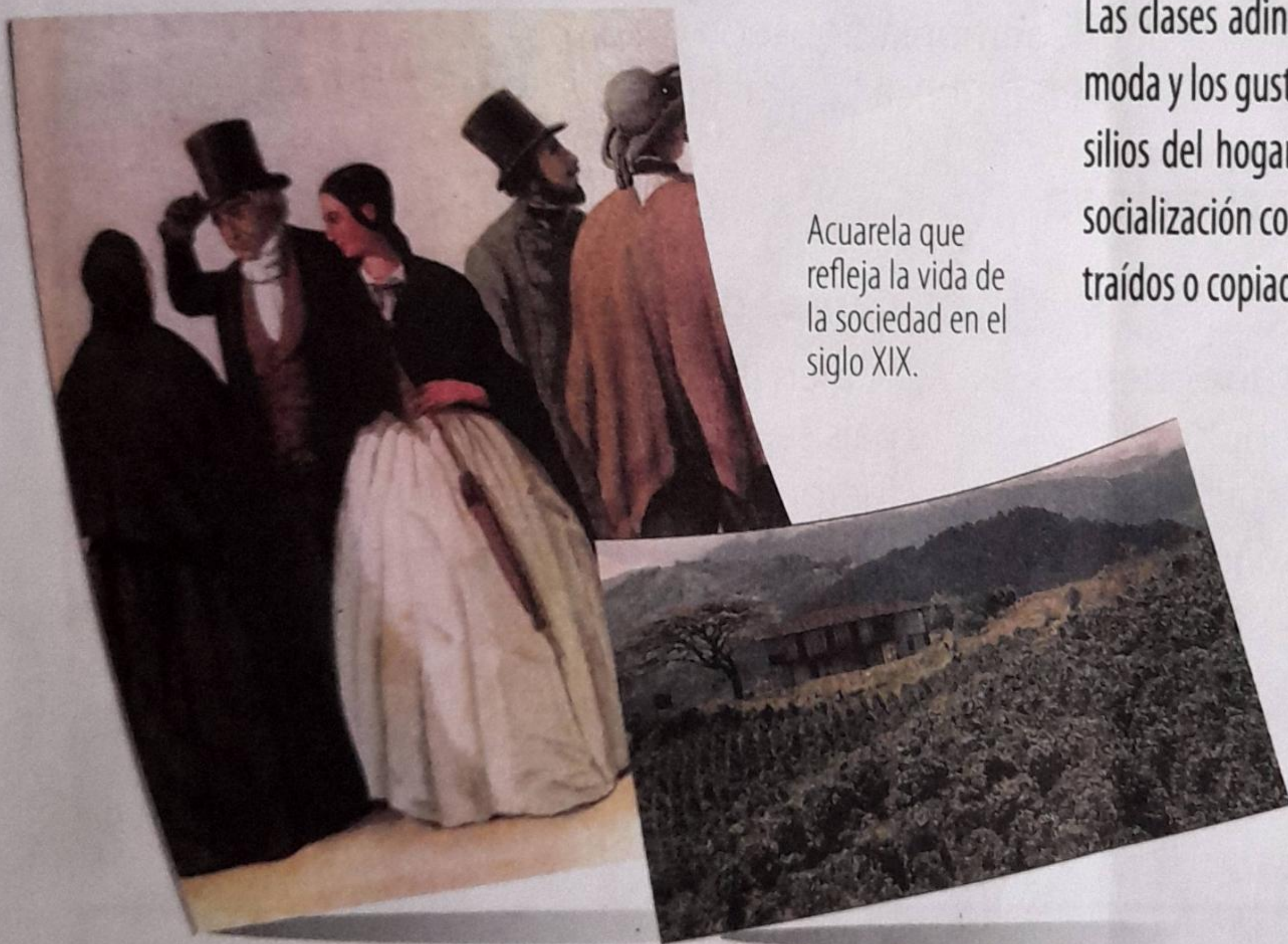
Acuarela que refleja la vida de la sociedad en el siglo XIX.

Durante la Colonia la explotación de oro había sido la principal actividad económica de Antioquia. Cuando la minería disminuyó, muchos campesinos de la región se fueron a buscar nuevas tierras hacia el sur y el oriente. Dotados de un hacha, un azadón, una pala y algunos objetos domésticos desmontaron las montañas y fundaron nuevos pueblos. El Viejo Caldas, compuesto por los departamentos de Quindío, Caldas y Risaralda, fue el resultado de este proceso. Con