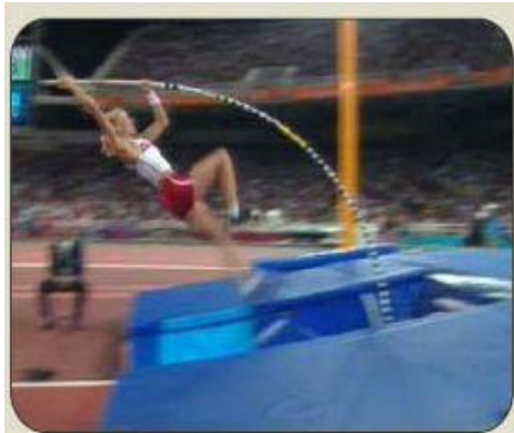
FLEXIÓN MÁXIMA DE LA PÉRTIGA. Comenzará el acercamiento de las piernas hacia arriba.

A medida que la pértiga se endereza, y con las piernas extendidas, el cuerpo adoptará distintas posiciones (L, J, I) , las cuales llevarán a éste a superar el listón.