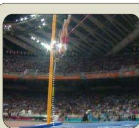
POSICIÓN DE "I"