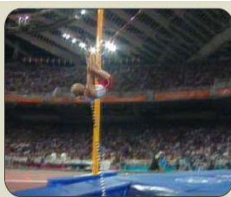
POSICIÓN DE "L"