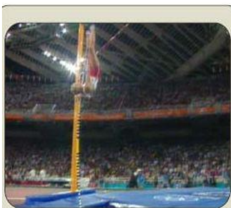
POSICIÓN DE "J"