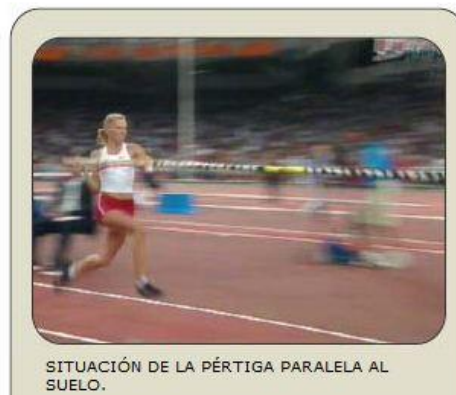
SITUACIÓN DE LA PÉRTIGA PARALELA AL SUELO.

La introducción tiene lugar durante los 3 últimos pasos (derecha, pértiga, izquierdo y batida). Una vez que la pértiga se encuentre dentro del cajetín se inicia la batida.