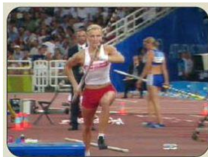
INICIO DE LA CARRERA

La pértiga irá descendiendo progresivamente hasta ponerse de forma paralela al suelo a medida que el saltador se acerca al cajetín.