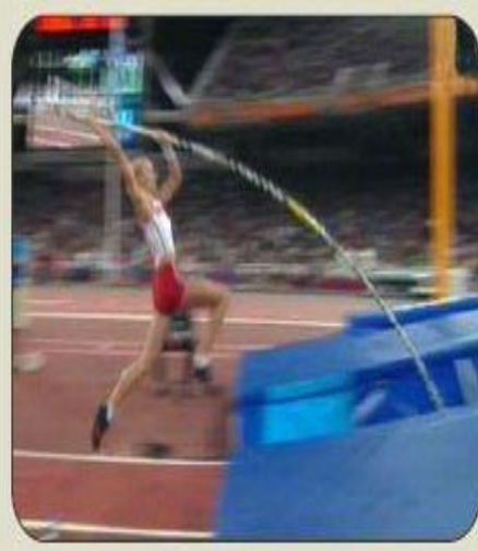
FLEXIÓN DE LA PÉRTIGA Y ABANDONO DEL SUELO.