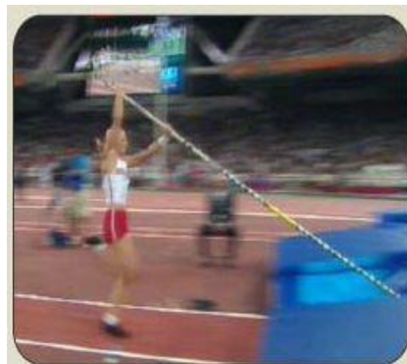
ENTRADA EN LA CAJA.

La introducción tiene lugar durante los 3 últimos pasos (derecha, pértiga, izquierdo y batida). Una vez que la pértiga se encuentre dentro del cajetín se inicia la batida.