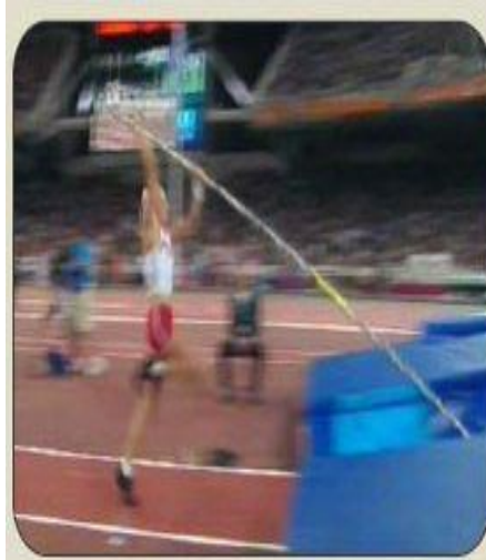
INICIO DE LA BATIDA.