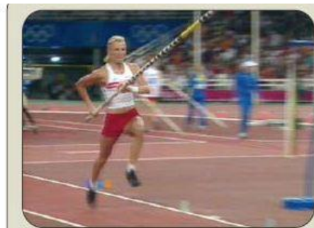
LA PÉRTIGA VA BAJANDO LENTAMENTE.