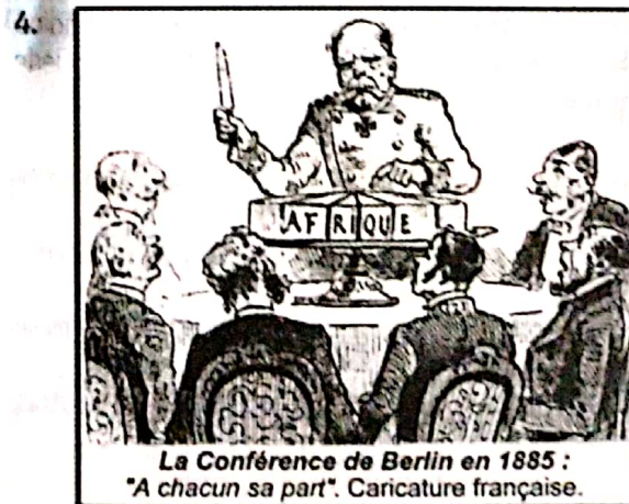
La Conférence de Berlin en 1885 : "A chacun sa part". Caricature française.

Des: 1.1 CSV / Compt. Historia y cultura / Comp. Interpretación y análisis de perspectivas