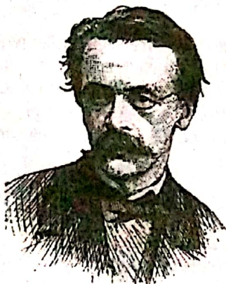
John L. O'Sullivan

En 1839, el periodista norteamericano John L. O'Sullivan escribió un artículo periodístico justificando la expansión territorial de los Estados Unidos. Según O'Sullivan, los Estados Unidos eran un pueblo escogido por Dios y destinado a expandirse a lo largo de América del Norte. Para O'Sullivan, la expansión no era una opción para los norteamericanos, sino un destino que estos no podían renunciar ni evitar porque estarían rechazando la voluntad de Dios. O'Sullivan también creía que los norteamericanos tenían una misión que cumplir: extender la libertad y la democracia ayudando a las razas inferiores. Las ideas de O'Sullivan no eran nuevas, pero llegaron en un momento de gran agitación nacionalista y expansionista en la historia de los Estados Uni-