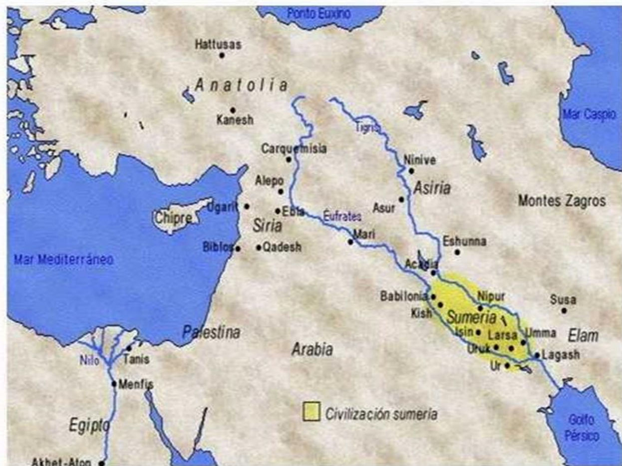
MAPA CIVILIZACIÓN SUMERIA

ESPACIO GEOGRÁFICO: MESOPOTAMIA, REGIÓN DEL CERCANO ORIENTE (ENTRE LOS RÍOS TIGRIS Y EUFRATES) ESTA CIVILIZACIÓN ES "LA CUNA DE LA HUMANIDAD".