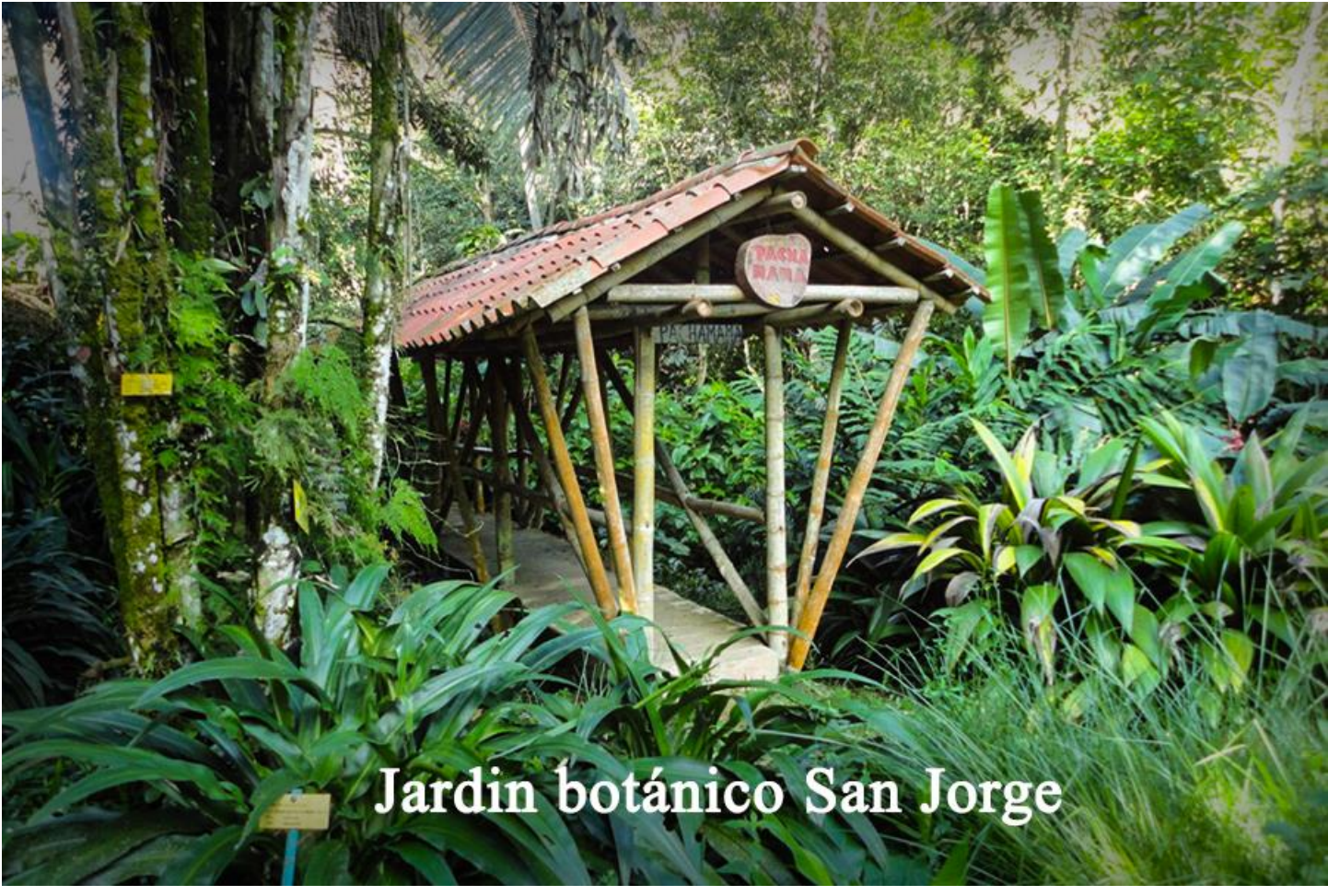
Jardin botánico San Jorge