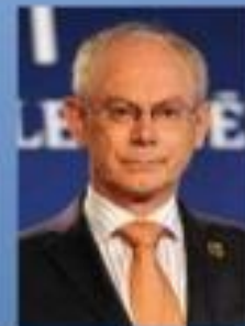
Herman Van Rompuy