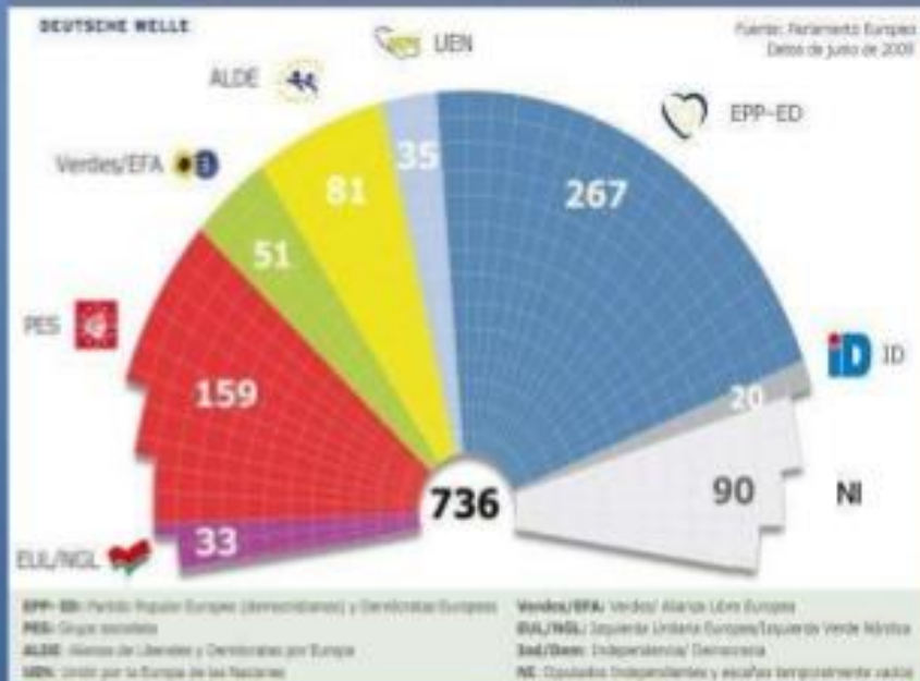
Distribución de escaños en el Parlamento Europeo