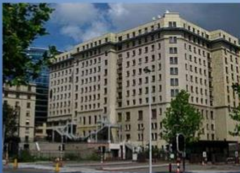
Residence Palace, sede del Consejo Europeo en Bruselas.

Formado por los jefes de Estado y de Gobierno, que se reúnen varias veces al año para establecer la política general de la Unión.