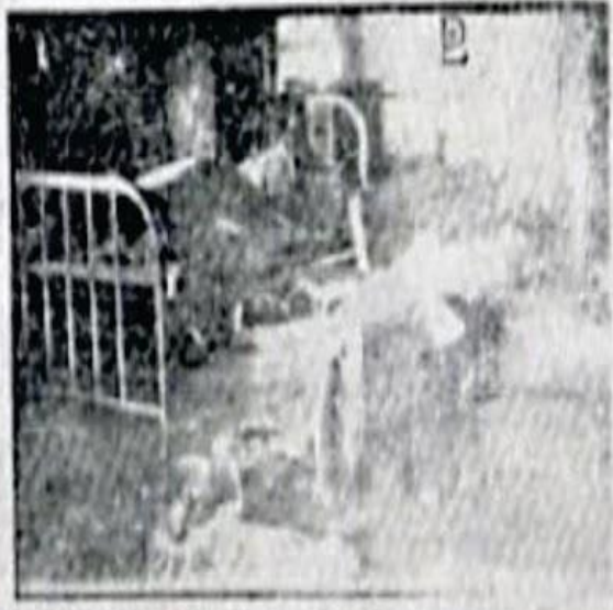
Imagen tomada desde el momento de la destrucción de la Ciudad Real...