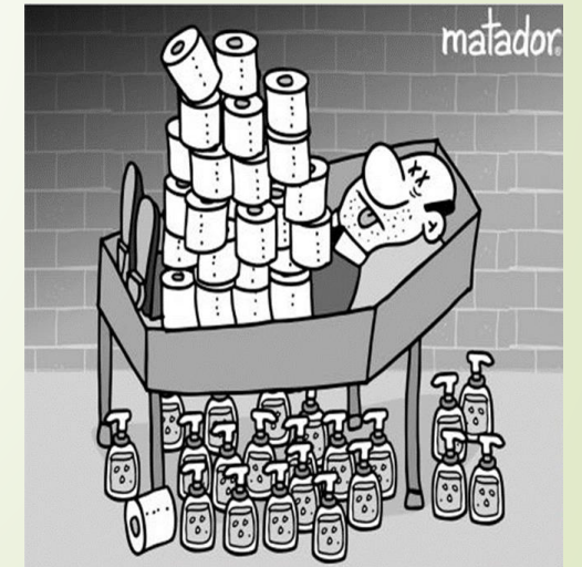
Nos mata el egoísmo