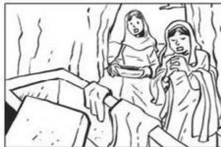
DOMINGO DE RESURRECCION