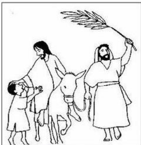
DOMINGO DE RAMOS