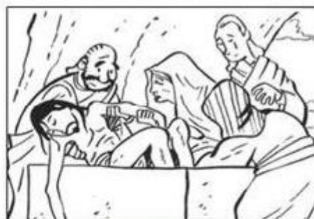
ENTIERRO DE JESUS