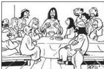
JUEVES SANTO: LA ULTIMA CENA