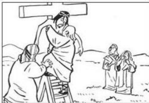
VIERNES SANTO: MUERTE DE JESUS