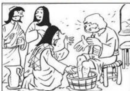
JUEVES SANTO: EL LAVADO DE LOS PIES