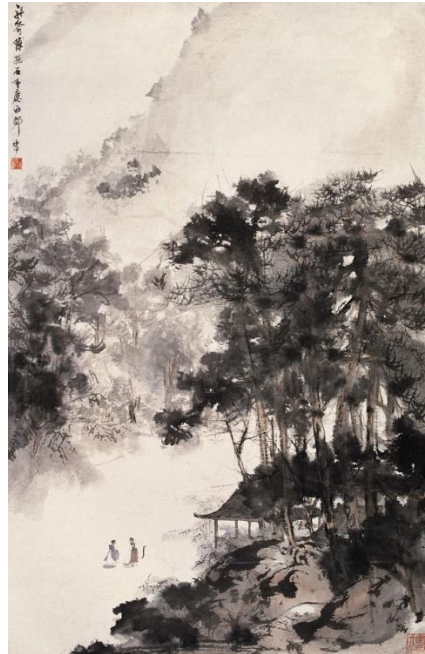
(Imagen 2).