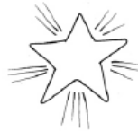
Star [star] Estrella