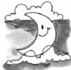
Moon [miun] Luna