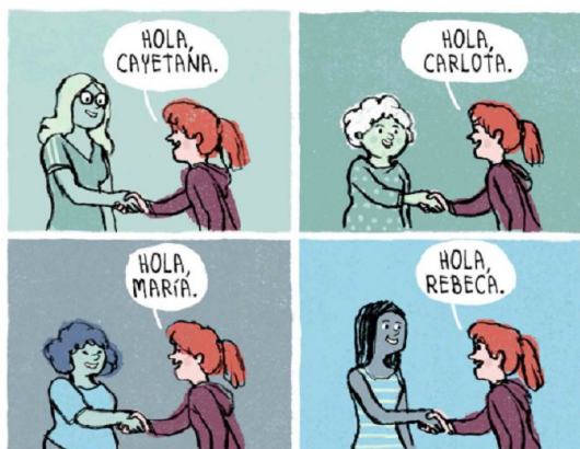
Figura 1. Ejemplo de Viñeta.

Cuadro o viñeta: está delimitado por líneas negras que representan un instante de la historieta. Normalmente de izquierda a derecha y de arriba abajo para representar un orden en la historia.