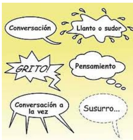
Figura 4. Ejemplo de globos

Globos: de diferentes formas para indicar lo que piensa, dice o el estado de ánimo de los personajes.