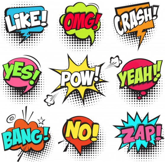
Figura 3. Ejemplo de onomatopeya

frases como boom, bang, plop, zoom, etc.