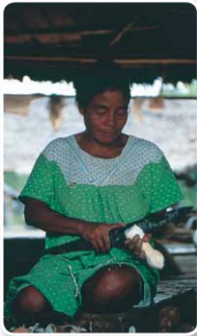
Mujer indígena del Amazonas rallando yuca brava.