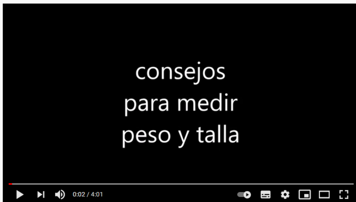
mediciones peso y talla