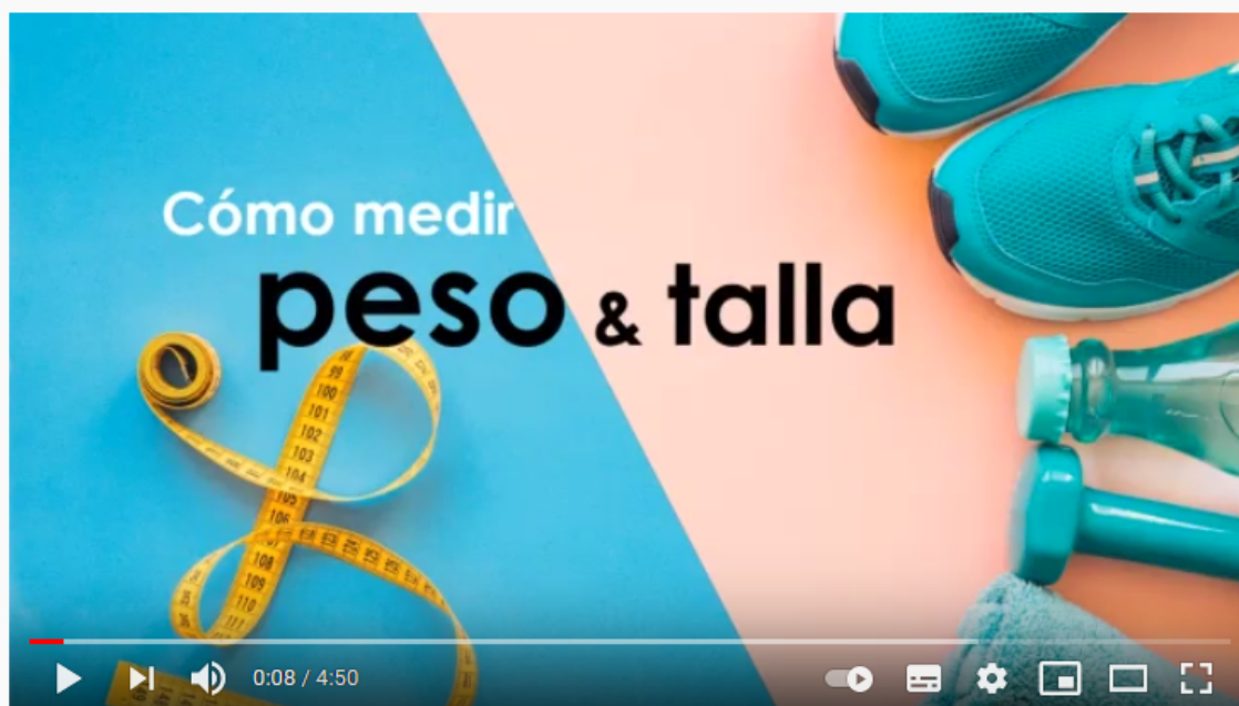
Cómo medir peso y talla correctamente