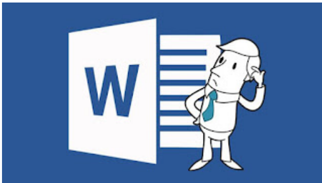
Entorno de Microsoft Word

Microsoft Word es un programa informático orientado al procesamiento de textos. Fue creado por la empresa Microsoft , y viene integrado predeterminadamente en el paquete ofimático denominado Microsoft Office .