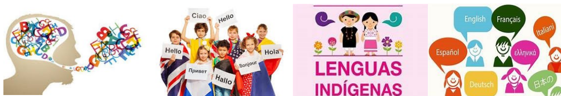
Imagen 1: Imagen 2: Imagen 3: Imagen 4:

Observe e interprete las siguientes imágenes y comente con sus palabras que le llamó la atención de cada una de ellas