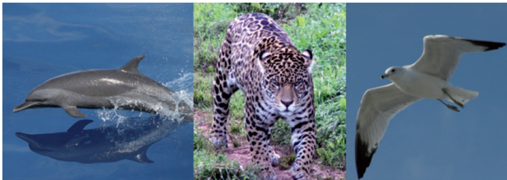
Animales que nadan