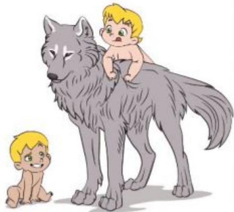
La leyenda de Rómulo y Remo

Una leyenda es una narración de hechos naturales o sobrenaturales, que se transmite de generación en generación en forma oral o escrita. En las leyendas que presentan elementos sobrenaturales, como milagros, presencia de criaturas extrañas o de ultratumba, etc., estos hechos se presentan como reales, pues forman parte de la visión del mundo propia de la comunidad en la que se origina la leyenda.