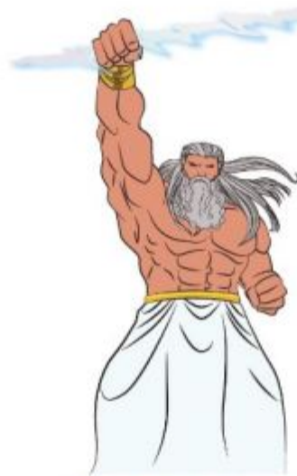
Zeús Dios Griego

Los mitos son relatos pertenecientes al género literario que se divulgan en forma oral de una generación a otra. Cuenta cómo se crearon los cielos, de dónde provienen los vientos, cómo nacen los propios dioses, u otro tipo de situaciones relacionadas a la vida humana. Los mitos nos transportan a un tiempo sagrado distinto al nuestro. En ellos participan seres y hechos sobrenaturales como dioses, o seres extraordinarios que no son humanos.