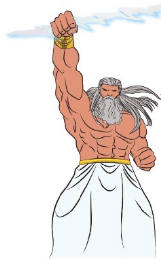
Zeús Dios Griego

Los mitos son relatos pertenecientes al género literario que se divulgan en forma oral de una generación a otra. Cuenta cómo se crearon los cielos, de dónde provienen los vientos, cómo nacen los propios dioses, u otro tipo de situaciones relacionadas a la vida humana. Los mitos nos transportan a un tiempo sagrado distinto al nuestro. En ellos participan seres y hechos sobrenaturales como dioses, o seres extraordinarios que no son humanos.