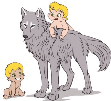
La leyenda de Rómulo y Remo

Una leyenda es una narración de hechos naturales o sobrenaturales, que se transmite de generación en generación en forma oral o escrita. En las leyendas que presentan elementos sobrenaturales, como milagros, presencia de criaturas extrañas o de ultratumba, etc., estos hechos se presentan como reales, pues forman parte de la visión del mundo propia de la comunidad en la que se origina la leyenda.