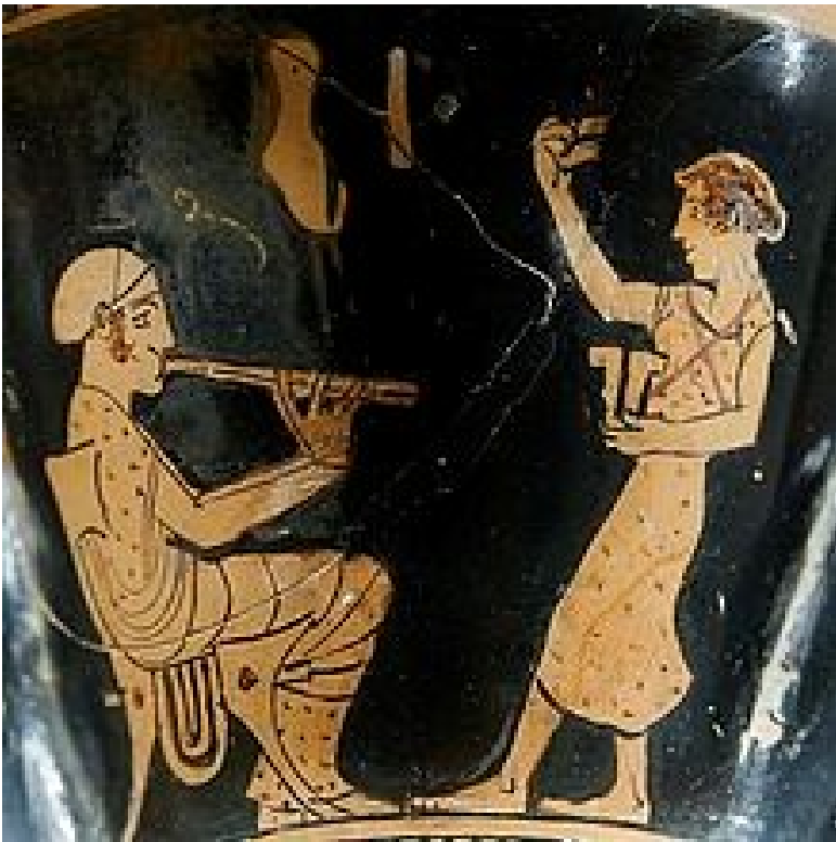
Música y bailarina griega, s. V adC.

En la pagina de tu cuaderno realiza la siguiente imagen de DANZA GRIEGA, utilizando para hacer el contorno un lápiz, pero para rellenar un color negro y tono cafe :