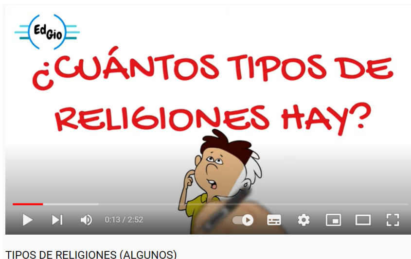
TIPOS DE RELIGIONES (ALGUNOS)